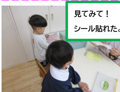
見てみて！ シール貼れたよ