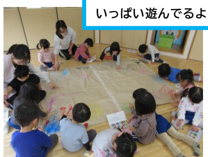
いっぱい遊んでるよ